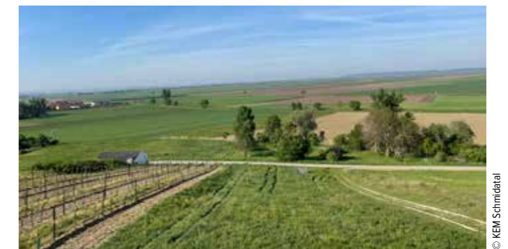
Der Trappenturm in Roseldorf - nur einer von vielen, schönen Aussichtspunkten entlang unserer regionalen Wanderwege.

Mit der abgeschlossenen Überarbeitung ist die Region für die kommende Wandersaison bestens gerüstet. Weitere Informationen erhalten Interessierte in den jeweiligen Gemeindeämtern oder beim Landschaftspark Schmidatal Manhartsberg unter 02959 2203 30 sowie info@schmidatal.at.