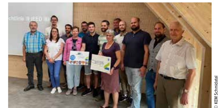
16 Gemeindevertreter:innen aus den KEM-Regionen Schmidatal und Wagram trafen sich am 30.07.2025 im neugebauten Gemeindeamt in Großweikersdorf und informierten sich über die neue EU-Energieeffizienzrichtlinie EED III.

Der Schwerpunkt des Informationsnachmittags wurde einerseits auf die Energieeffizienz als auch auf mögliche Energieeinsparungsmöglichkeiten bei öffentlichen Gebäuden gelegt. So erhielten die 16 teilnehmenden Gemeinden neben einem Überblick zur EED III auch konkrete Handlungsempfehlungen, um die Umsetzung vor Ort best- und schnellstmöglich bewerkstelligen zu können. Denn gemäß EED III-Richtlinie ist die Erstellung und Veröffentlichung einer vollständigen Gebäude-Inventarliste pro Gemeinde bis