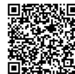
Weiterleitung zur KEM-Homepage und dem zugehörigen Artikel

Sie wünschen sich eine Druckversion des Informationsdokuments? Sehr gerne können wir Ihnen dieses Informationsdokument auch ausgedruckt zukommen lassen. Wir bitten Sie um Bekanntgabe Ihrer Kontaktdaten über das Kontaktformular unseres Partners „Jotform“. Im Sinne der Nachhaltigkeit geben wir erst nach Erhalt einer Anfrage den Druckauftrag!