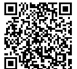
Kontaktformular „Jotform“ zur Bestellung der gedruckten Infobroschüre